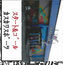
カスカブスポーツ センター