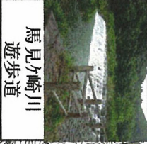
馬見ヶ崎川 遊歩道