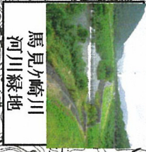
馬見ヶ崎川 河川緑地